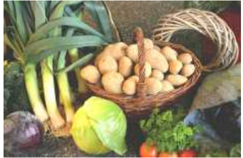
Erntedank - Gabe

Erntedank bietet eine gute Gelegenheit, auch an die zu denken, denen es nicht so gut geht.