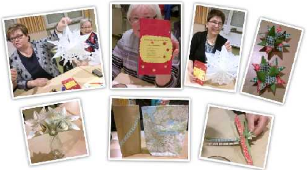
Bilder vom Kreativabend der KFD St. Wendelinus Zellhausen

Die kfd Zellhausen wünscht allen Frauen und ihren Angehörigen ein friedvolles Weihnachtsfest und für das kommende Jahr Gesundheit und Gottes Segen.